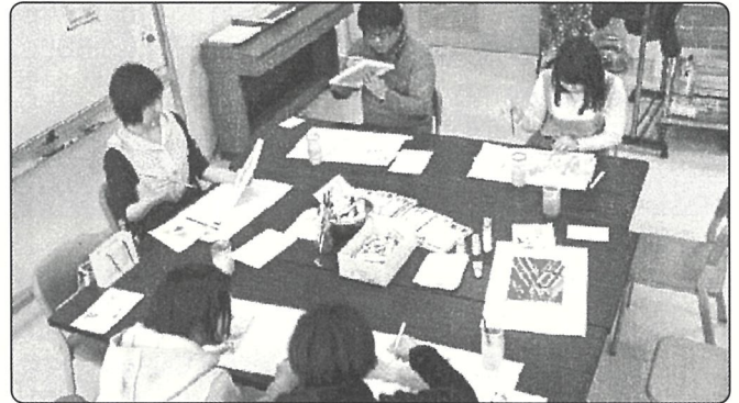
▲NPO 法人 コンカリーニョ

地域における住民の自主・協働によるコミュニティ再生活動や、これらを担う人材を育成することを目的に、コミュニティやまちづくり、NPOなどの地域活動に関心のある方を対象にした講座など、札幌市、石狩市、江別市、恵庭市、北広島市、千歳市、帯広市、網走市、北見市、中標津町、真狩村の11市町村で開催しました。