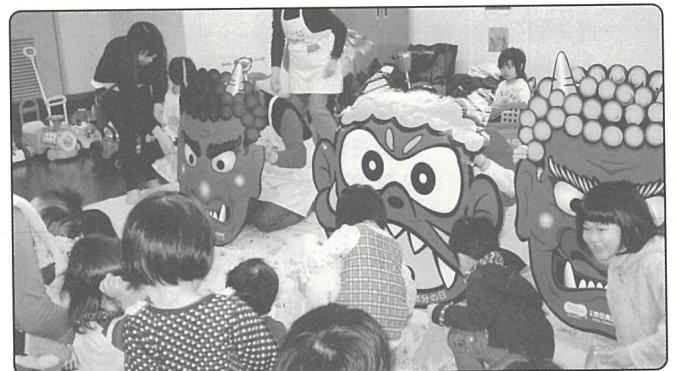
▲西区おもちゃ図書館ボランティアグループ たんぼほの会