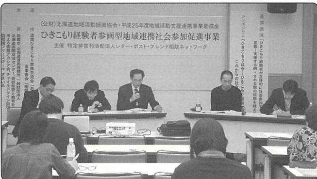
▲NPO 法人 レター・ポスト・フレンド相談ネットワーク