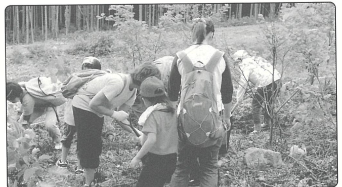
▲渡島みどりネットワーク